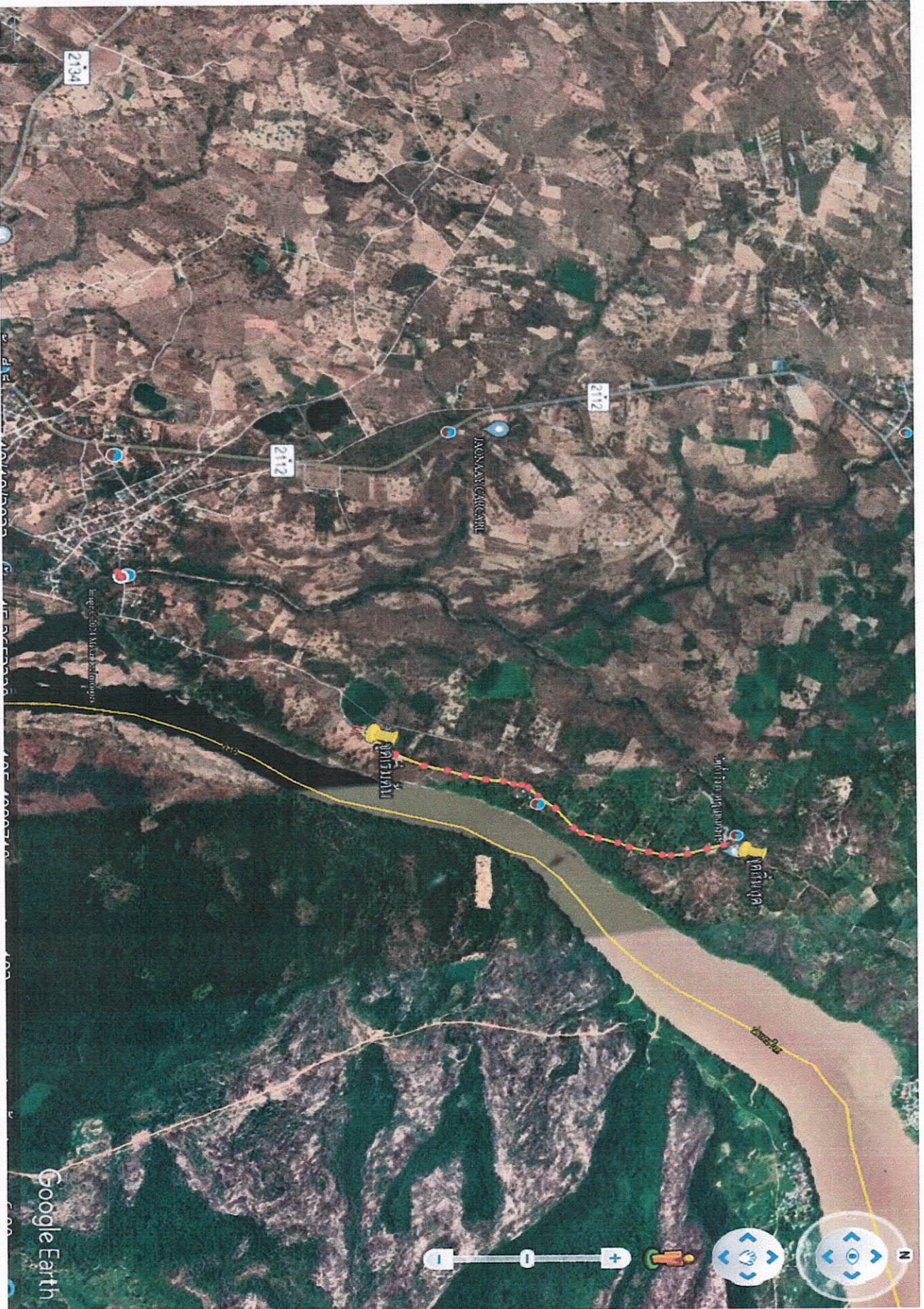
แผนผังแสดงบริเวณปรับปรุงถนนลูกรัง (เส้นทางพากห้วย-บ้านหนองผือน้อย) หมู่ที่ 2 บ้านห้วยหมาก