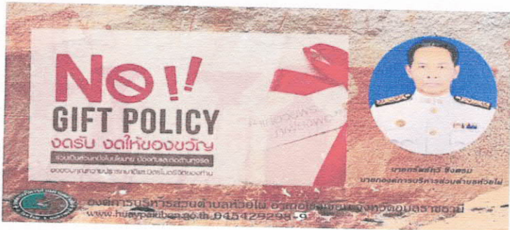
ประกาศเจตจำนง (คลิก)